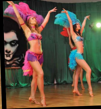
Karnawał po brazylijsku.