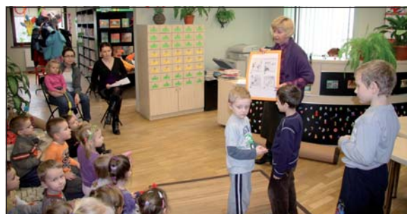
Przedszkolaki podczas ferii w Bibliotece.

Zdzisława Godawa Biblioteka Publiczna, Oddział dla Dzieci