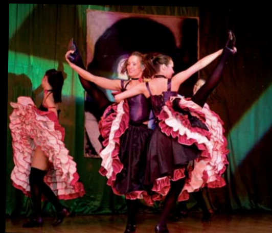
To był kankan...