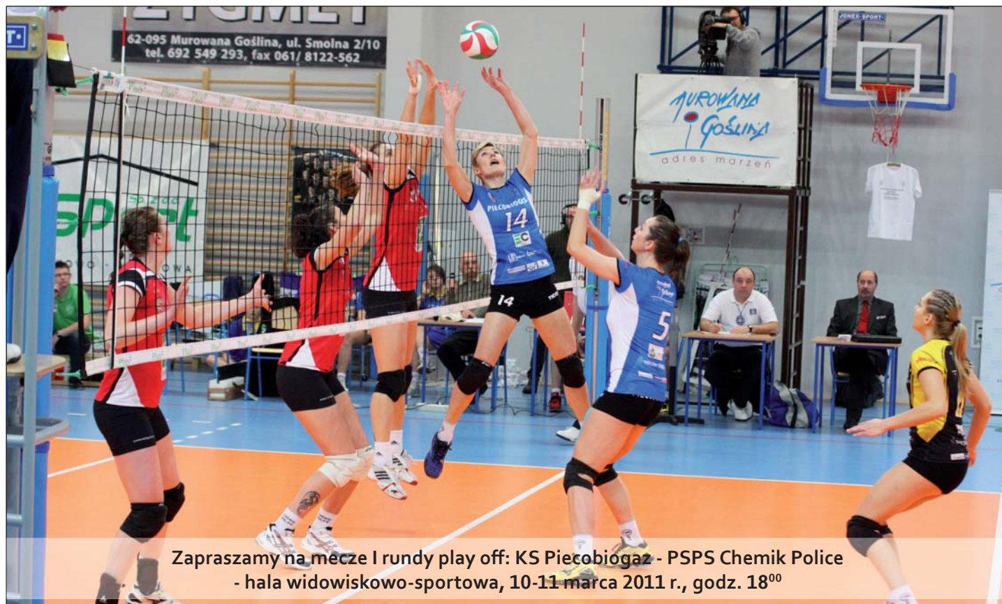
Zapraszamy na mecze I rundy play off: KS Piecobiogaz - PSPS Chemik Police - hala widowiskowo-sportowa, 10-11 marca 2011 r., godz. 18 00