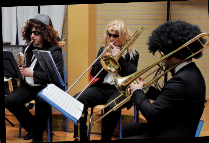
Orkiestra niczym „Muppet Show”.