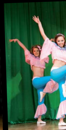
Grupa taneczna „Fa