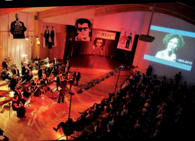
Pierwszy utwór zadedykowano Whitney Houston.