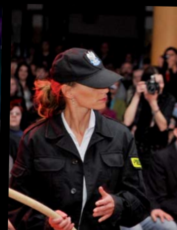
Chcą aresztować dyrygenta?