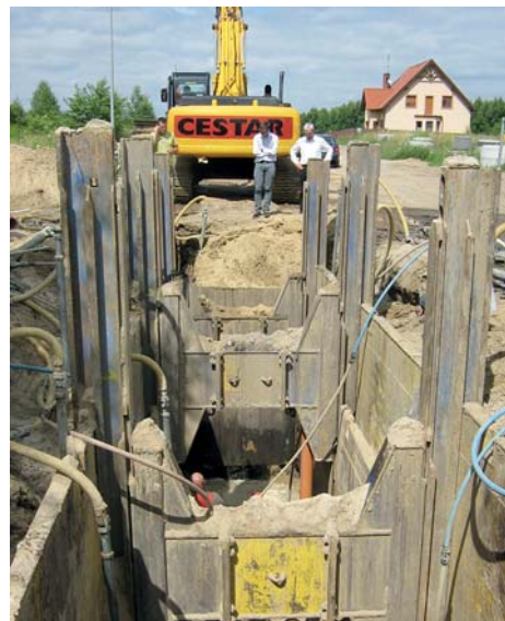
Budowa kanalizacji sanitarnej w Rakowni.

Po budowie kanalizacji sanitarnej trwa odtwarzanie nawierzchni dróg i chodników.