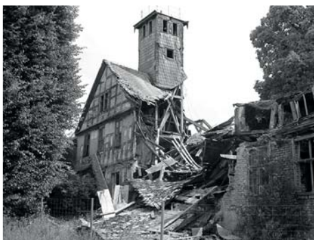
Obecny stan pałacu w Łopuchowie.