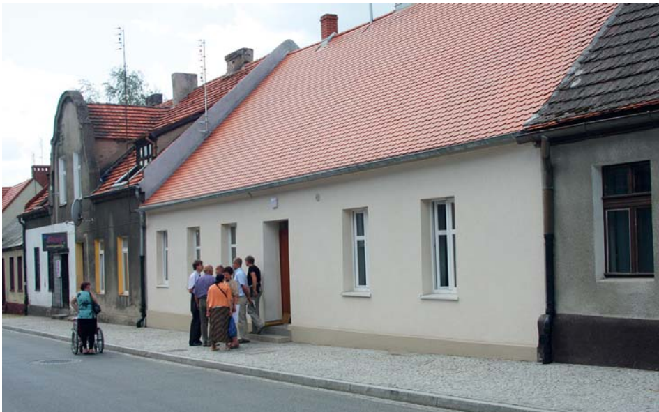
Kolejne budynki komunalne wyremontowane.

Remont budynku przy ul. Kochanowskiego 10 objął m.in.: wymianę pokrycia dachowego, wymianę obróbek blacharskich, rynien i rur spustowych, remont ścian elewacyjnych – uzupełnienie tynków i pomalowanie, wykonanie docieplenia z lekkich materiałów wraz z wykonaniem podłogi z desek, naprawę schodów zewnętrznych, remont drzwi wejściowych do budynku, wykonanie pomieszczenia socjalnego (WC), zagospodarowanie terenu podwórza.