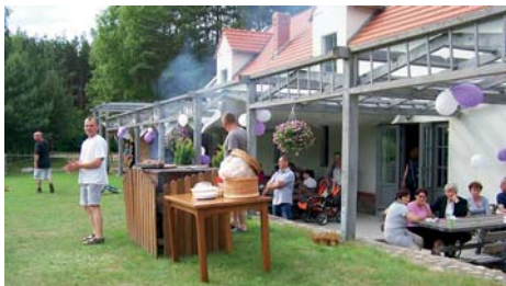
Dzień Dziecka w Kamińsku.