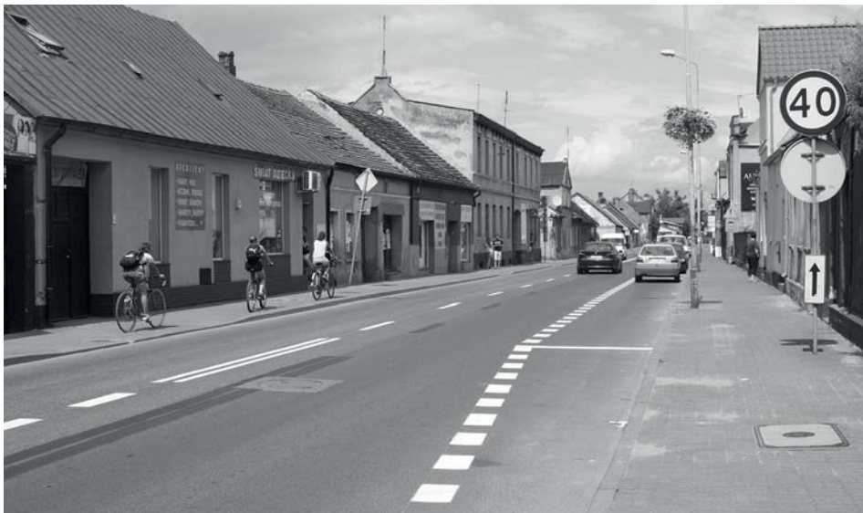
Nowa organizacja ruchu i parkingi przy ul. Rogozińskiej.

szkolnych. W nowej organizacji ruchu autobus szkolny będzie się zatrzymywał po stronie szkoły podstawowej.