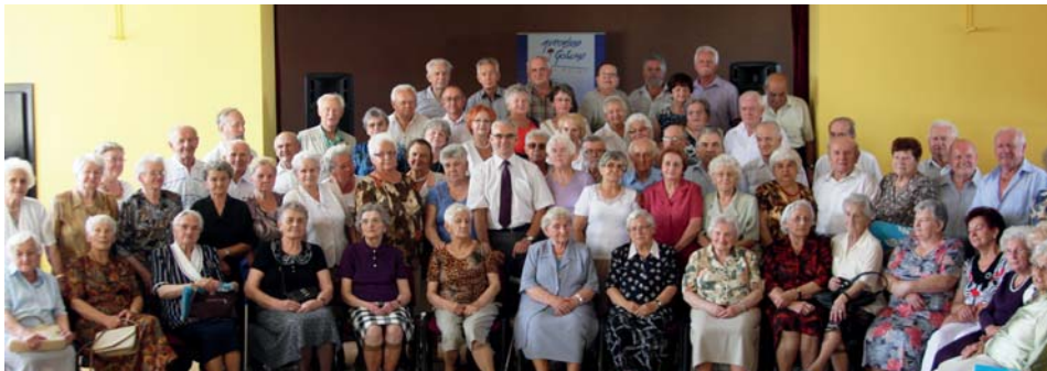
Światowy Zjazd Gośliniaków.