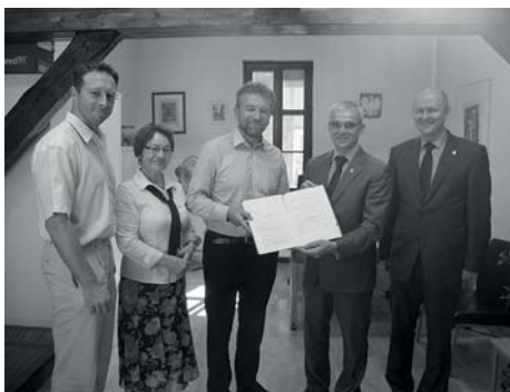
Podpisanie aktu notarialnego.

Liczymy, iż po uporządkowaniu stanu prawnego obiektu i sprzedaży zespół dworsko-parkowy w Łopuchowie choć w części odzyska swój dawny blask.