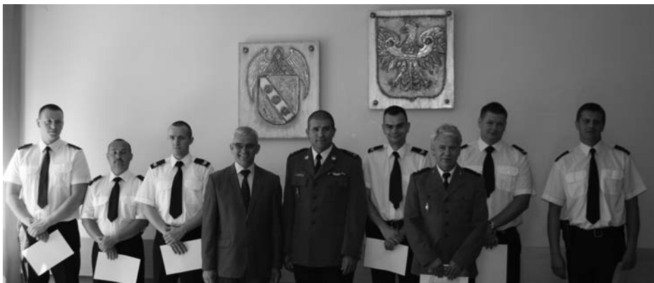
Wręczenie awansów policjantom podczas spotkania 30 lipca.

W kalendarzu Święto Policji wypada 24 lipca, natomiast lokalne uroczystości odbyły się 30 lipca br. z udziałem Komendanta Miejskiego Policji w Poznaniu, Burmistrza Murowanej Gośliny oraz służb współpracujących z goślińską policją: Straży Miejskiej i Straży Leśnej.