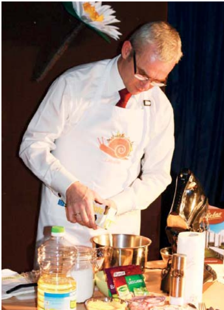
Burmistrz przygotowuje specjal pod nazwą „omletopizza”.