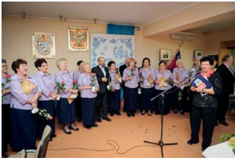
Zespół Śpiewaczy „Goślinianka”.