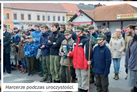
Harcerze podczas uroczystości.