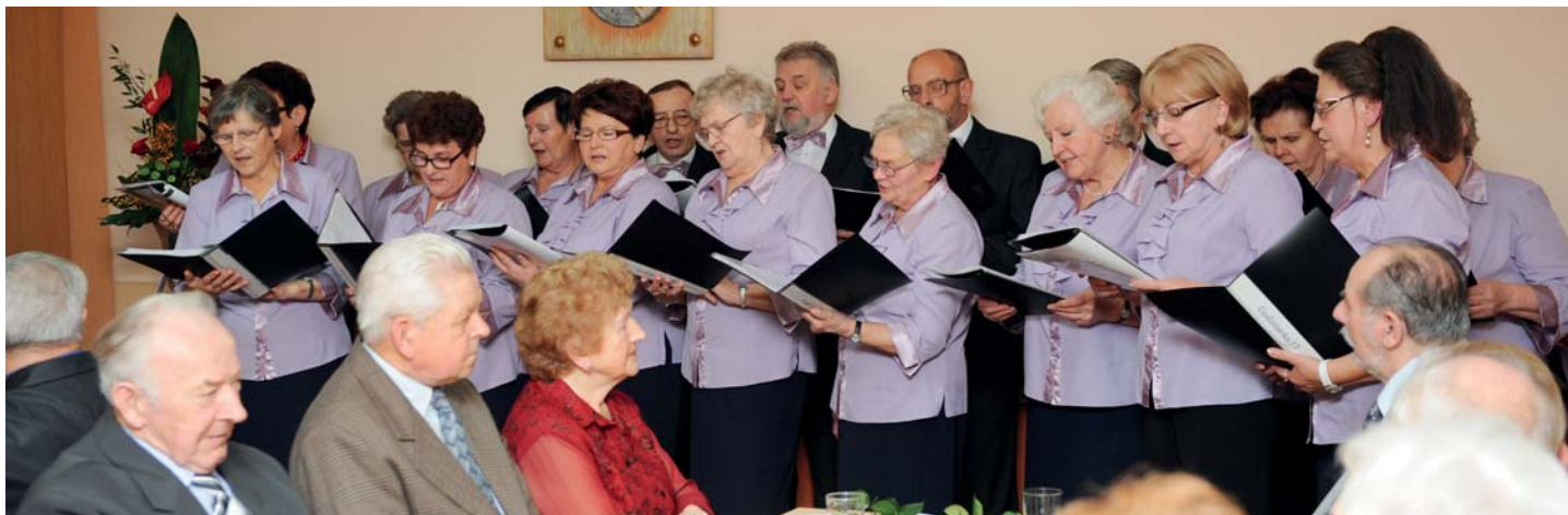
Podczas uroczystości z okazji "Dnia Seniora" wystąpił Zespół Śpiewaczy "Goślinianka".