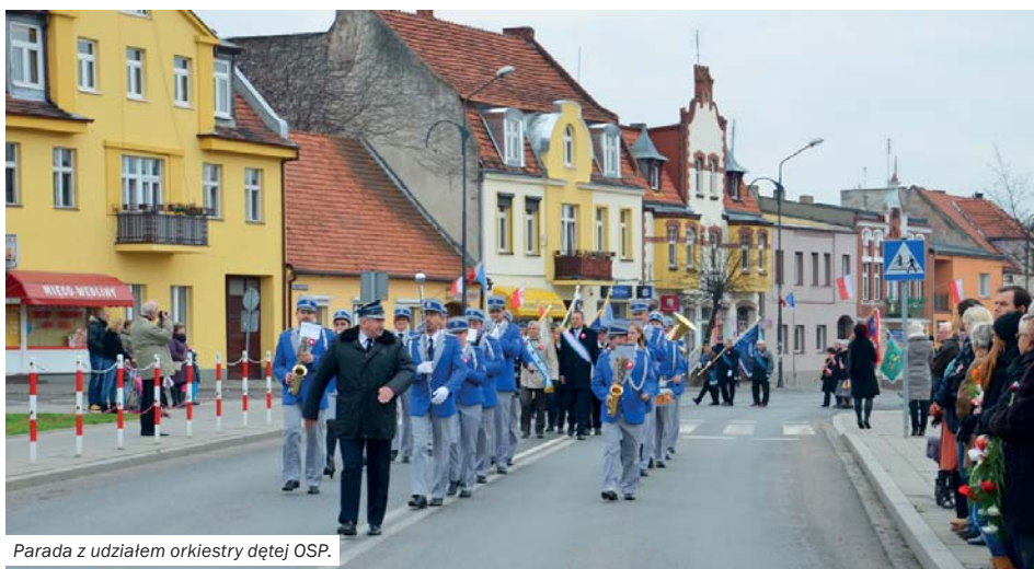
Parada z udziałem orkiestry dętej OSP.

7 listopada - III Powiatowy Konkurs Piosenki