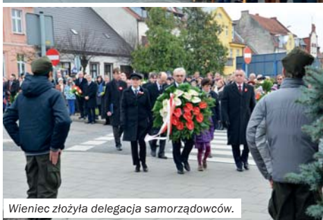
Wieniec złożyła delegacja samorządowców.