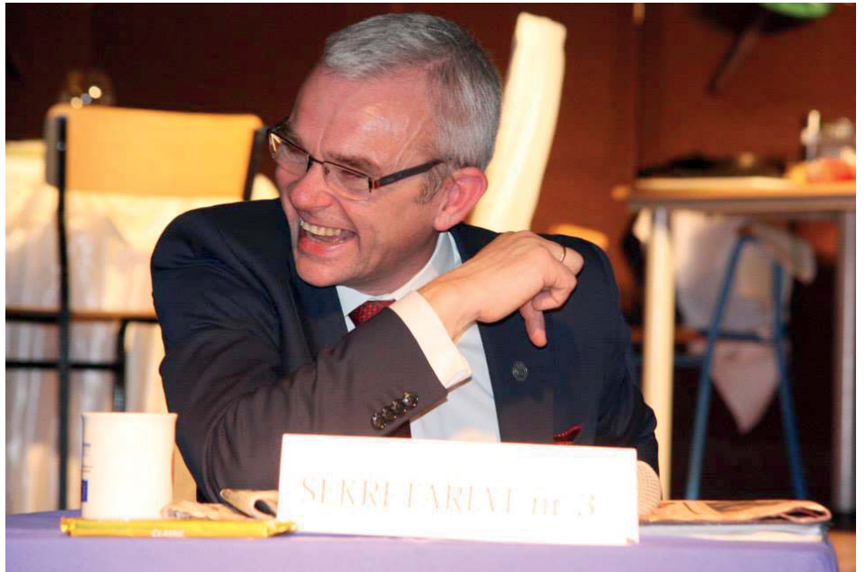
Burmistrz zapraszany był po kolei do 4 biurek, gdzie otrzymywał zadania do wykonania.