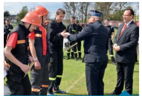
Wręczenie nagród zespołom strażackim.

jak drewno i skóra zwierzęca, tzw. djamba, bębnach afrykańskich mogły zagrać dzieci i dorośli, tworząc w ramach warsztatów rytmiczne wariacje międzypokoleniowe pozytywnych wibracji.