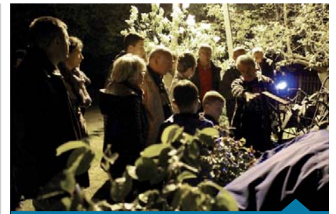
Nocne zwiedzanie Długiej Gośliny.

Na zakończenie, ok. godziny 23.00, obydwie grupy spotkały się w Agroturystyce Anielinek, gdzie przy ognisku degustowa-