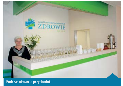
Podczas otwarcia przychodni.