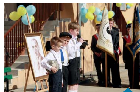
Występ uczniów w części artystycznej.

powstańca”, przenoszenie „ranego powstańca” na noszach. Rywalizacja była zacięta, ale najważniejsza okazała się dobra zabawa! Zespoły nagrodzono dyplomami i słodyczami. Po zakończonym turnieju wszyscy udali się na boisko szkolne, gdzie na uczniów czekała niespodzianka – pyszny tort, a na gości poczęstunek przygotowany przez uczniów Zespołu Szkół im. D. Chłapowskiego w Murowanej Goślinie.