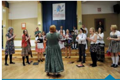
16 maja, koncert festiwalowy Chór Kameralny ZUT w Szczecinie.