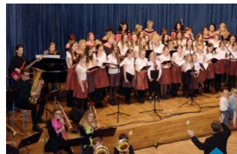
15 maja, Inauguracja Festiwalu Prima Vista Brass z Hemmingen i Chóry Canzona.

Poziom muzykowania młodzieży niemieckiej był bardzo satysfakcjonujący. Publiczność życzliwie nagradzała brawami wykonania popularnych, znanych piosenek z repertuaru m. in. zespołu ABBA, The Beatles, Chicka Core'a, Coldplay, Micha-