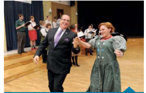
Było wspólne śpiewanie, a na nawet taniec z burmistrzem.