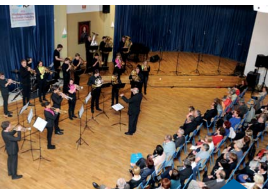
INAUGURACJA VIII MIĘDZYNARODOWEGO FESTIWALU CHÓRALNEGO