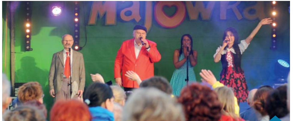
Kabaret Antosia Szprychy rozbawił publiczność do łez.

Rodzinnym piknikiem zaczęła się część artystyczna majówki. „Przystanek Zdrówko”, przygotowany przez Filharmonię Pomysłów swoim ekoprogramem dla najmłodszych i rodziców był świetną okazją do szaleństw z ekoplastyką, ekosportem, ekomuzyką. W barwnym korowodzie pod sceną prezentowały się w tańcu przed królową naturą z ekoprzeszaniem dla wszystkich. Można było wziąć udział w wielu konkurencjach sportowych z wykorzystaniem ekosprzętu, np. kręgli wykonanych z butelek pet. Na prawdziwie etnicznej uczcie zaprosili bębniarze. Na przygotowanych instrumentach wykonanych ręcznie z naturalnych materiałów