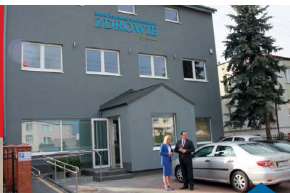
NOWA PRZYCHODNIA W MUROWANEJ GOŚLINIE