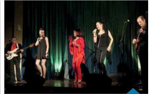
Tercet Egzotyczny na scenie w Murowanej Goślinie.