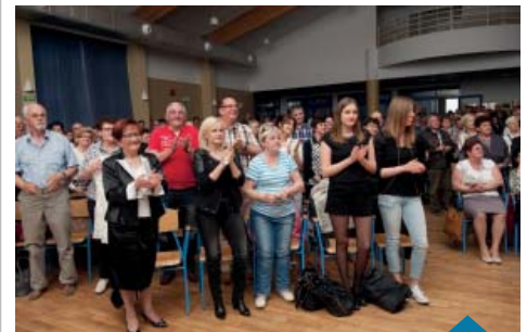
Publiczność podczas koncertu Tercetu Egzotycznego.