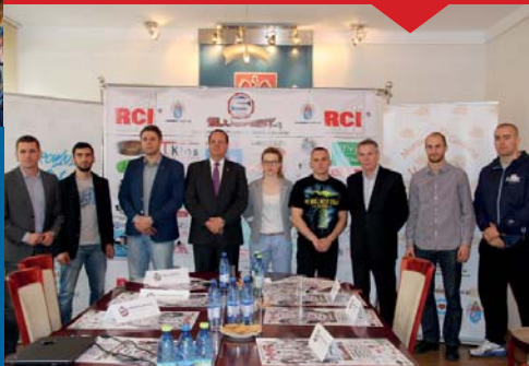
GALA MMA SLUGFEST W MUROWANEJ GOŚLINIE