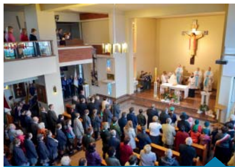
Msza św. w intencji Ojczyzny.