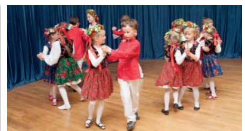
Występ Zespołu Folklorystycznego Goślinianie.

Możemy być dumni, że nasze dzieci i młodzież mają taką pasję, którą potrafią rozwijać i dzielić się nią z innymi - a to nie jest łatwe. My mamy okazję podziwiać, wspierać i cieszyć się razem z nimi. Na zakończenie każdy zespół i opiekunowie otrzymali dyplom i pamiątkową statuetkę z rąk Burmistrza Miasta i Gminy Muro-