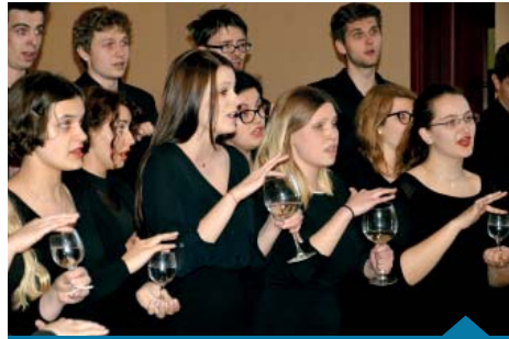
18 maja, koncert Chóru Kameralnego Akademii Muzycznej.