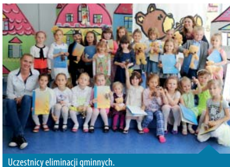
Uczestnicy eliminacji gminnych.

Poziom prezentacji wokalnych był bardzo wysoki. Wszystkie dzieci miały bardzo dobrze dobrane piosenki do swoich możliwości wokalnych i wiekowych. Jednak