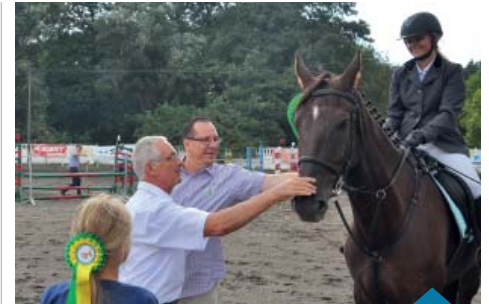
Także burmistrz zawiązał do naszej stajni i wręczył nagrody.

Jak co roku przybyły tłumy widzów, przyglądających się zmaganiom sportowym oraz uczestniczących we wspólnych zabawach zapewnianych przez profesjonalnych animatorów oraz wolontariuszy związanych ze stajnią w Raduszynie. Obecnych na imprezie było nawet kilkaset osób.