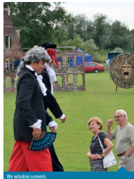
We włoskiej scenarii.

XIII Jarmark św. Jakuba przebiegał w tonacjach włoskich: od aranżacji stadionu, przez muzykę po kulinaria. Na płycie stadionu stanęła spora makieta rzymskiego Koloseum, replika Ust Prawdy, a także jedna z najbardziej znanych włoskich postaci bajkowych – Pinokio. Dzięki warsztatom kulinarnym „Mamma Mia” mogliśmy skosztować włoskich pyszności: tuńczyka z rabarborem, krewetek w sosie słodko-ostry, bruschetty z pomidorami. Bo Włochy to nie tylko – jak się wielu wydaje – pizza!