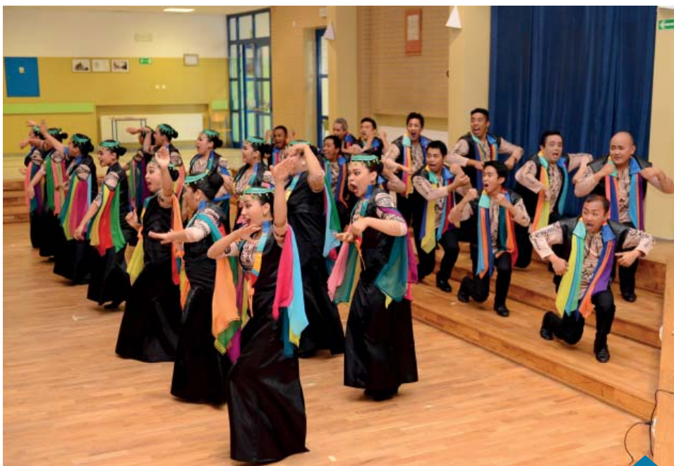
The University of the Philippines Concert Chorus (Chór Koncertujący Uniwersytetu Filipińskiego).

Po chwili przerwy, kiedy zespół zmienił stroje koncertowe, rozpoczęła się druga część koncertu. W programie znalazły się niezwykle barwne kompozycje, oparte o rodzimy folklor. Te wyrafinowane opracowania wykonane były z ruchem. Choreografia całej tej części koncertu była równoważnym i równie perfekcyjnie wykonanym