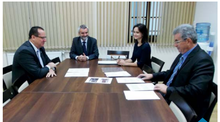
Podpisanie umowy ze spółką Pak Projekt.