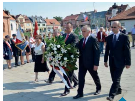
Hołd ofiarom II wojny światowej złożyły: władze samorządowe, delegacje szkół i organizacji oraz poczty sztandarowe.

Arleta Włodarczak