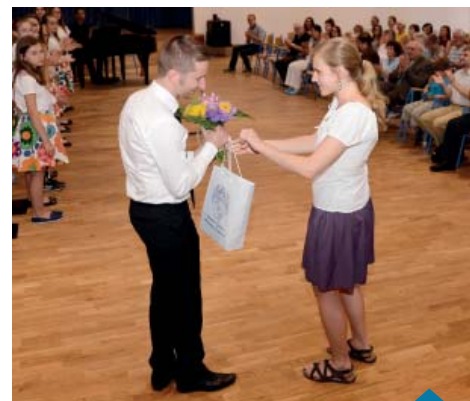
Podziękowania po koncercie.