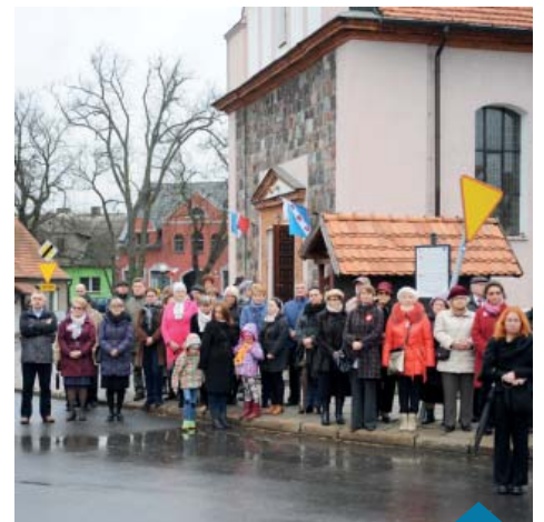
Mieszkańcy na pl. Powstańców Wielkopolskich.