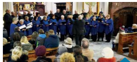
Chór Mieszany Vocantes.