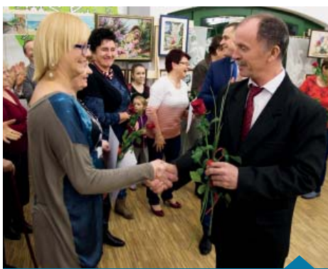
Podziękowania dla autorów prac.