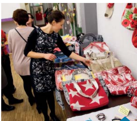
Dziesiątki cudnych przedmiotów.