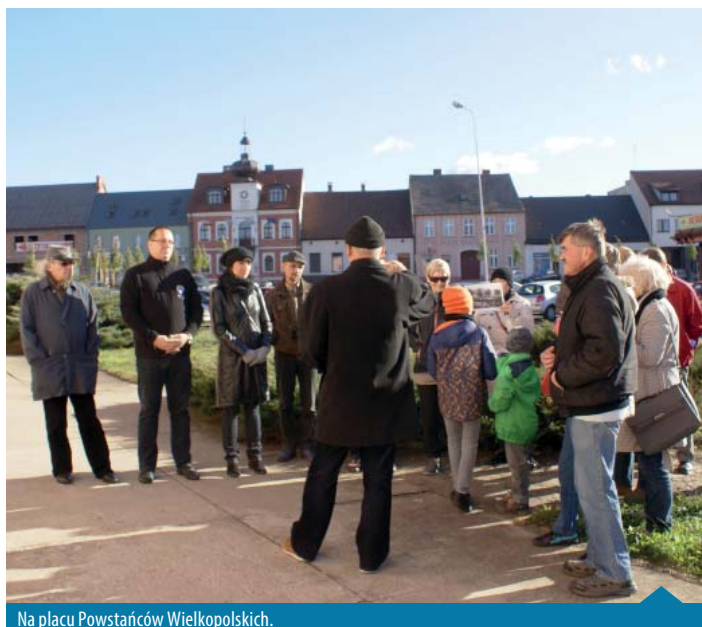
Na placu Powstańców Wielkopolskich.