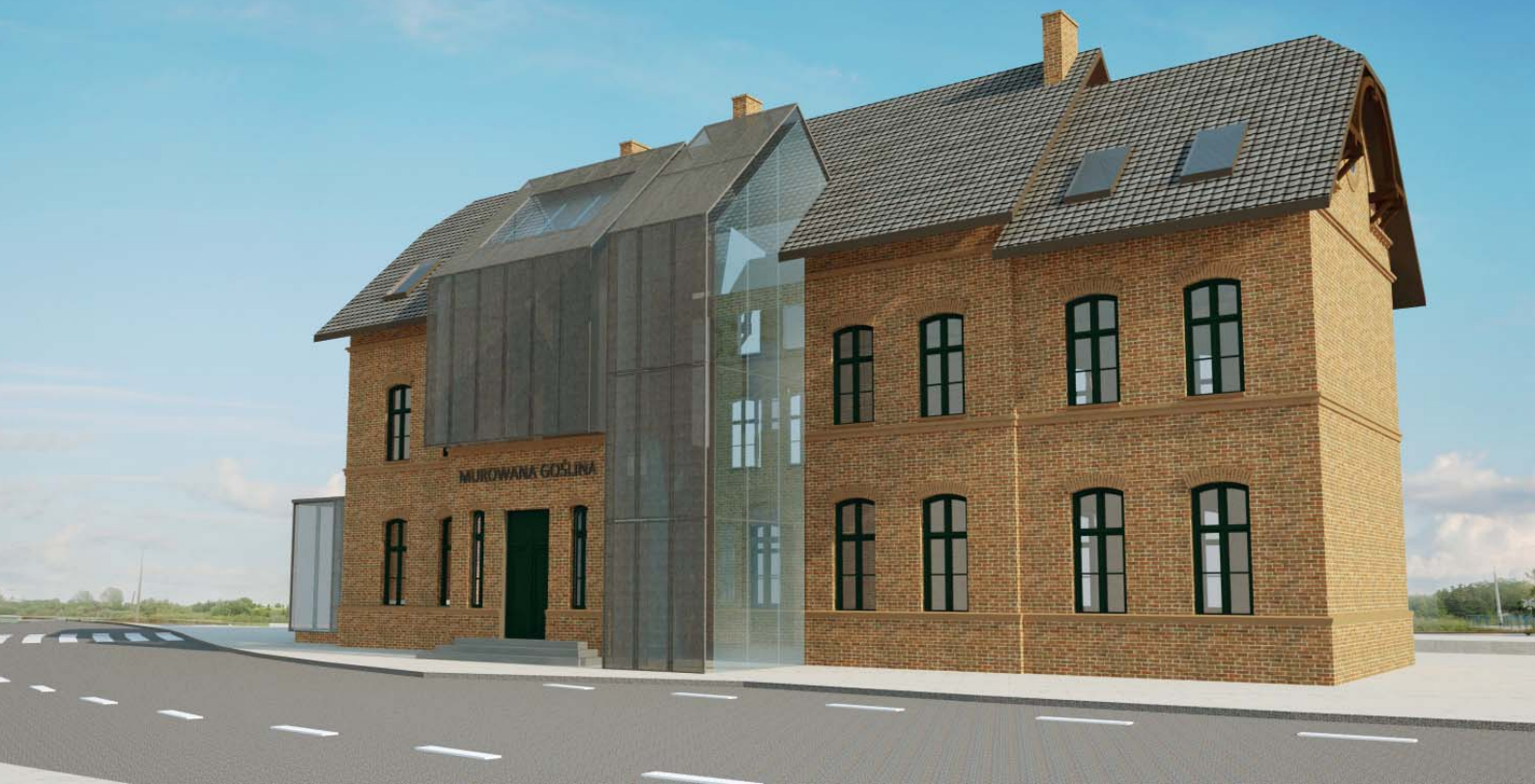
Dworzec w Murowanej Goślinie - wizualizacja.