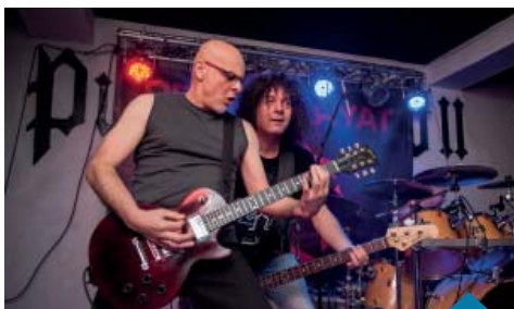
Zespół Proletariat i...