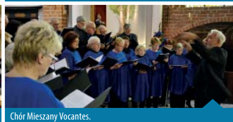
Chór Mieszany Vocantes.