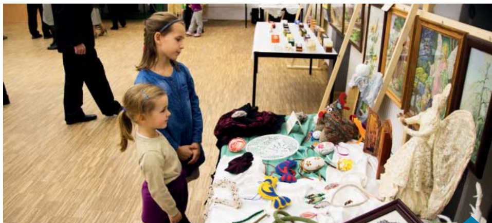
Wystawa w Rakowni.

▶ Obrazy, rzeźby, pisanki, bombki i anioły, torby oraz lalki – osób, które w Rakowni zajmują się rękodziełem jest przynajmniej kilkanaście. Prace 15 pań i jednego pana można było oglądać w dniach 21-22 listopada w świetlicy wiejskiej w Rakowni, gdzie odbyła się pierwsza wystawa rękodzieła mieszkańców Rakowni.