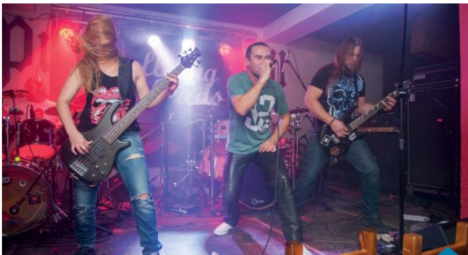
Zespół Flying Heads.

Nikt spośród 250 uczestników koncertu nie powinien narzekać na brak wrażeń, bo zespół pokazał, że mimo 27 lat na scenie jest ciągle w wielkiej formie,