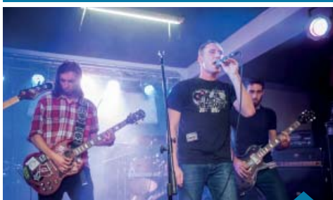
Zespół The Bj's.