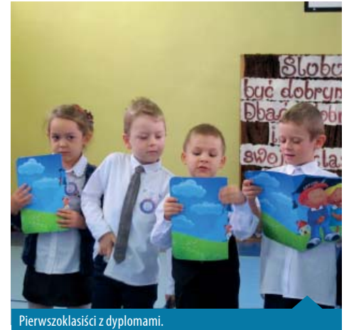
Pierwszoklasiści z dyplomami.