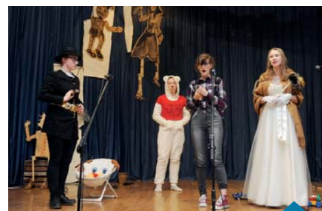
Grupa Teatralna „Hipo-kryci”.