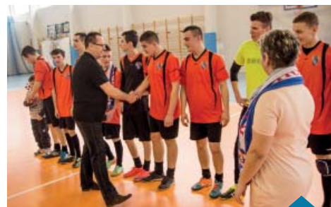
Uchorowo - drugie miejsce w turnieju.

Osiedle nr 1 – 4 pkt.; Złotoryjsko – 3 pkt.; Długa Goślina – 2 pkt.; Głębocko – 1 pkt.