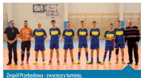
Zespół Przebędowa - zwycięży turnieju.

Klasyfikacja generalna TJP po 1 z 4 turniejów: Przebędowo – 10 pkt.; Uchorowo – 9 pkt.; Łopuchowo – 8 pkt.; Rakownia – 7 pkt.; Kamińsko – 6 pkt.; Białężyn – 5 pkt.;