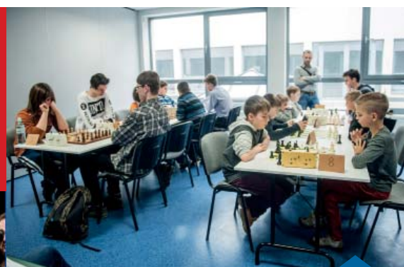
XIX MISTRZOSTWA MUROWANEJ GOŚLINY W SZACHACH