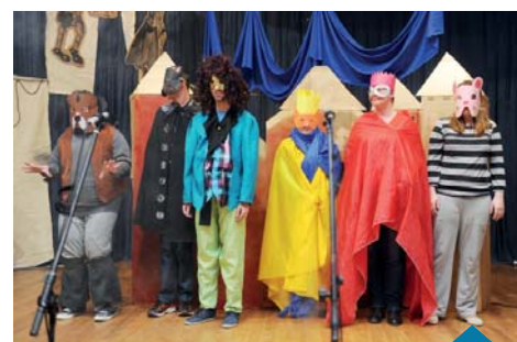
Grupa Teatralna WTZ w spektaklu „Był sobie król”.