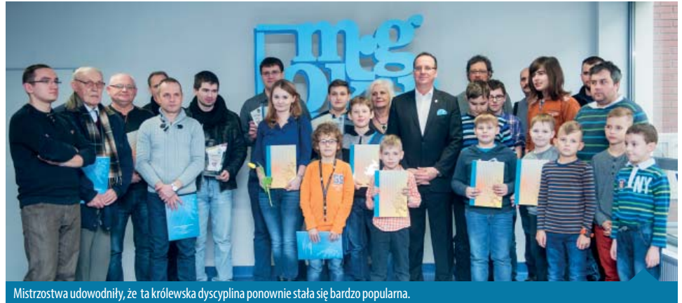
Mistrzostwa udowodniły, że ta królewska dyscyplina ponownie stała się bardzo popularna.