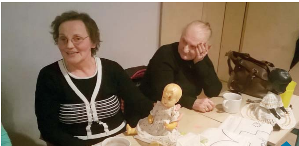
Dwukrotnie gościliśmy przedstawicielki Koła Gospodyń Wiejskich z Długiej Gośliny oraz seniorki z Klubu Seniora „Zacisze”.