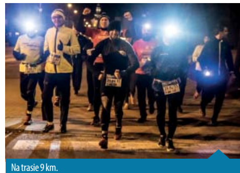
Na trasie 9 km.