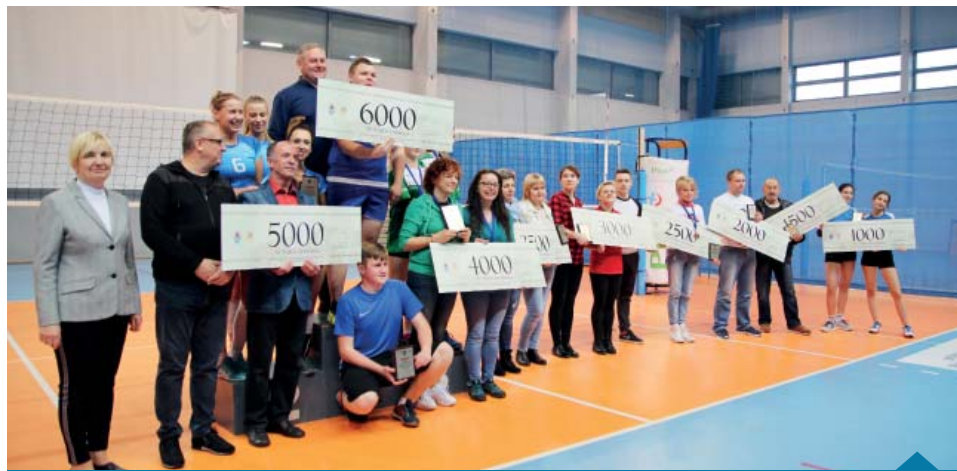
Jednostki nagrodzone po podliczeniu punktów za cykl turniejów.

Klasyfikacja generalna (po 4 turniejach) – zamieszczona w tabeli.