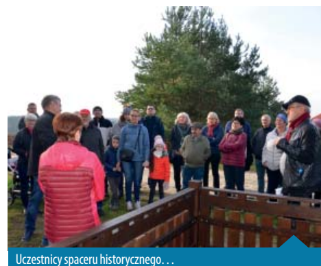
Uczestnicy spaceru historycznego...