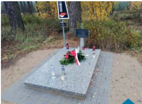
Nowa płyta pod lasem w Białężynie.

▶ W październiku bieżącego roku, w związku z bardzo złym stanem technicznym płyty kamiennej w Miejscu Pamięci Narodowej pod lasem w Białężynie, Burmistrz Miasta i Gminy Murowana Goślina zlecił wykonanie nowej płyty, wraz z utwardzeniem terenu wokół niej.