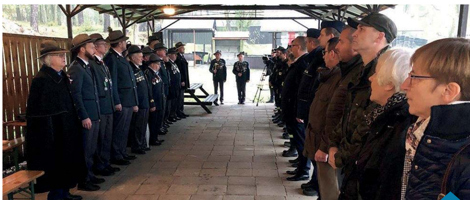
Mimo niesprzyjającej pogody uczestnicy dopisali.