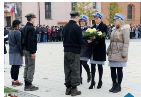
Delegacja Orkiestry Dętej OSP podczas złożenia wiązanki.