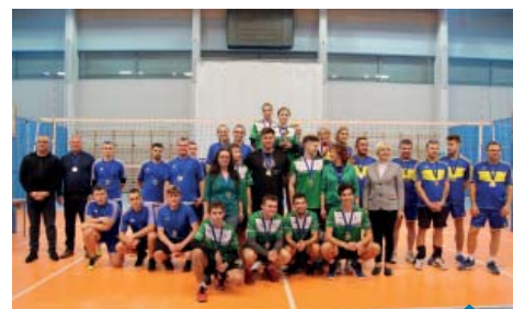
Zwycięzcy turnieju siatkarskiego.