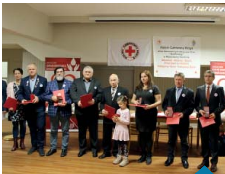
Wyróżnieni „Medalem 100-lecia PCK”.