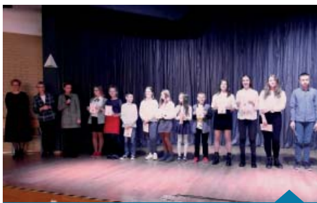
Spółcześni klasowi 2019/2020.

W auli budynku przy ulicy Mściszewskiej klasy piąte, szóste, siódme i ósme zrealizowały projekt pt. „Karol Marcinkowski wczoraj i dziś”. Uczniowie klasy ósmej przypomnieli sylwetkę naszego patrona i jego postawę w czasie zaborów oraz przygotowali konkurs dotyczący wybitnego