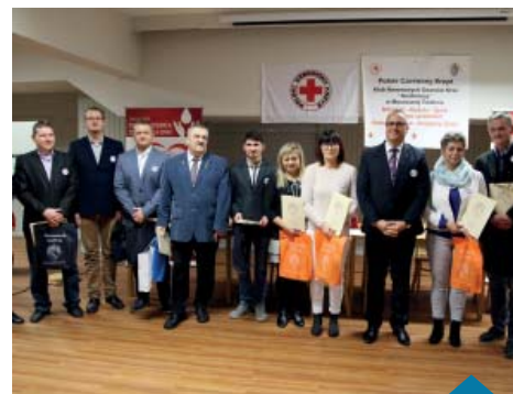
Nagrody od Gminy Murowana Goślina za działalność na rzecz PCK.