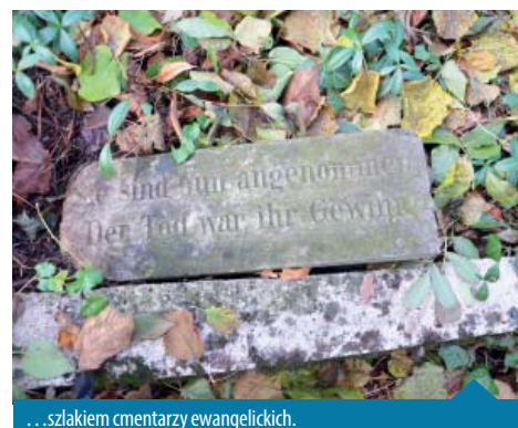
...szlakiem cmentarzy ewangelickich.