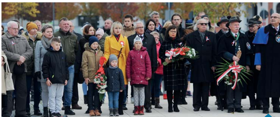
Mieszkańcy i delegacje podczas uroczystości na pl. Powstańców Wlkp.

11 listopada w Kościele pw. św. Jakuba Apostoła odbyła się msza św. w intencji Ojczyzny, koncelebrowana przez ks. dziekana grudzień 2019