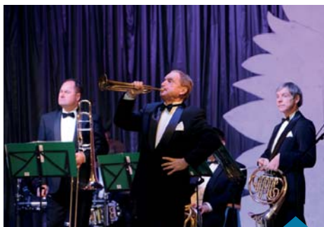
Koncert Capelli Zamku Rydzyskiego.