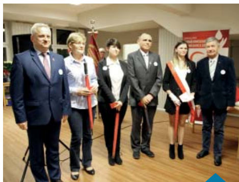
Honorowi Dawcy Krwi nagrodzeni za oddane litry krwi.