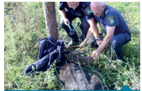
Strażnicy podczas akcji uwalniania daniela.