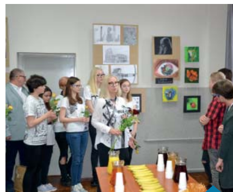
Kolejne spotkanie młodych artystów ze swoim mistrzem.

Tekst: Beata Springer