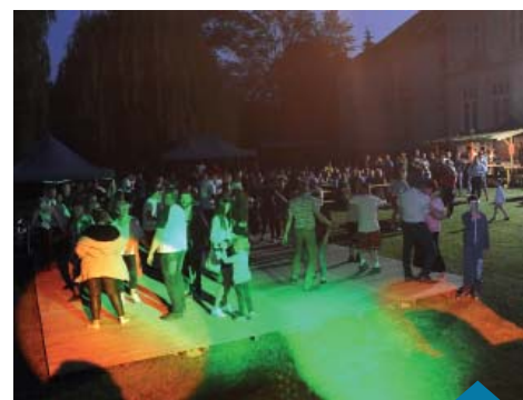
Zabawa taneczna z zespołem Twisters.