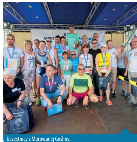
Uczestnicy z Murowanej Gośliny.

Arleta Włodarczak; dyrektor biegu