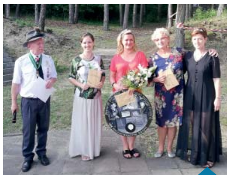
Zwycięzcy w strzelaniu do tarczy ustępującej Królowej.