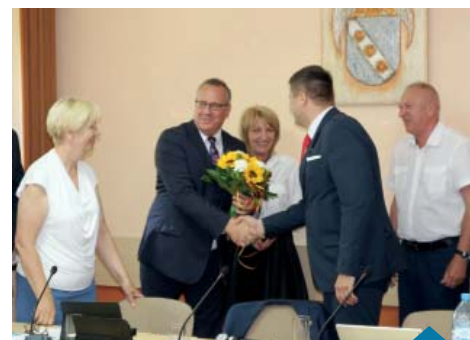
Gratulacje dla burmistrza od radnych Rady Miejskiej.