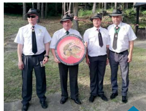
Strzelecki Król Zielonoświątkowy oraz Rycerze.