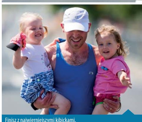
Finisz z najwierniejszymi kibickami.