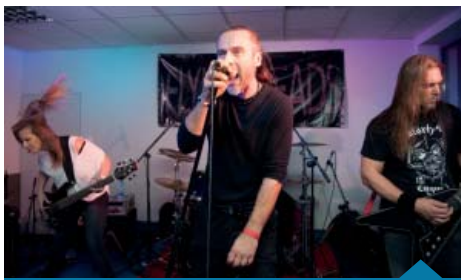
Flying Heads – na ten występ czekała stała publiczność.

Flying Heads – na ten występ, podobnie jak na płytę (!) czekała szczególnie stała i wierna publiczność. Fani nie mogli się oderwać od sceny, a wokalista wykorzystał ich zapał, zapraszając czasem do wspólnego wyśpiewania... pardon, wykrzyczenia