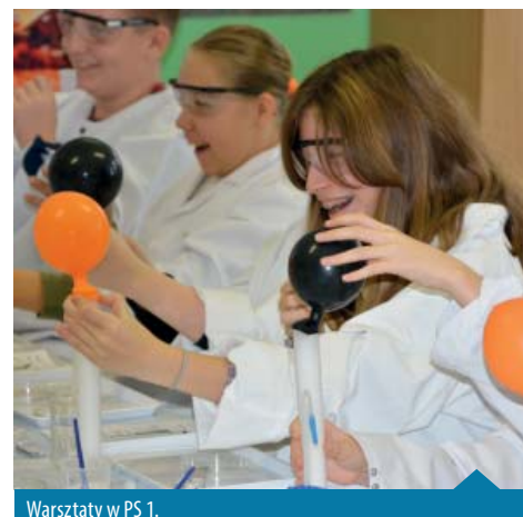
Warsztaty w PS 1.