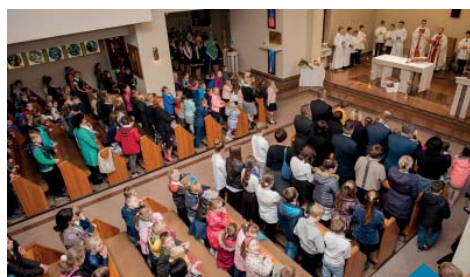
Obchody rozpoczęła msza święta.