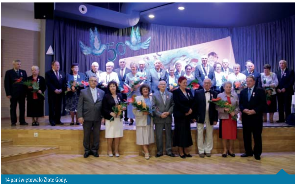
14 par świętowało Złote Gody.