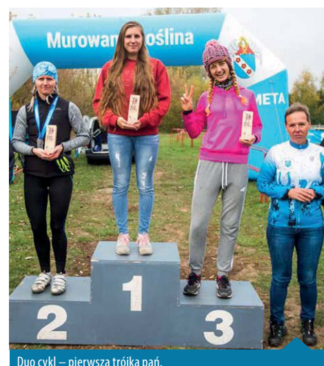
Duo cykl – pierwsza trójka pań.