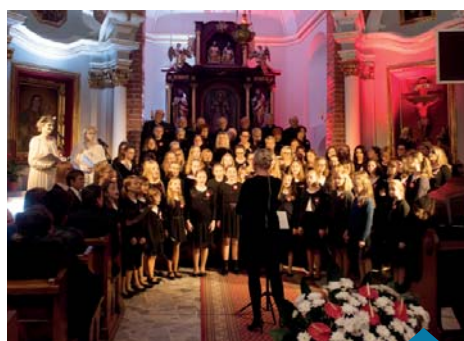
Koncert „Niepodległa” był wydarzeniem muzyczno-teatralnym.

Bartłomiej Stefański