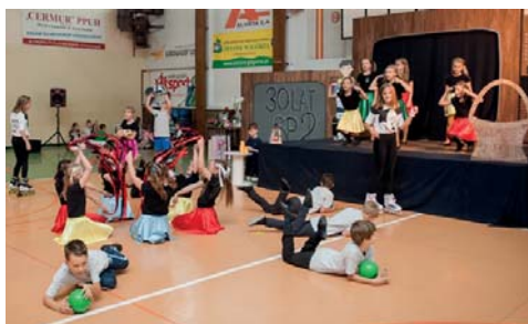
Pokazy taneczne uczniów SP2.