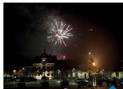
Wieczorem plac i ratusz rozjaśniły fajerwerki.