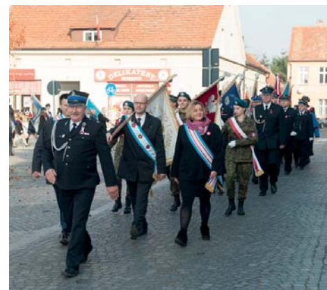
↑ Pocztę sztandarową przemaszerowały pod fasadę ratusza.