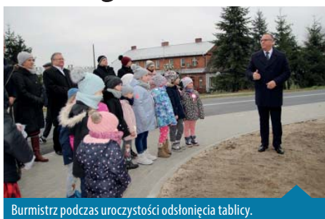
Burmistrz podczas uroczystości odsłonięcia tablicy.