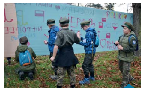
Na terenie całego miasta rozgrywano okolicznościową grę....