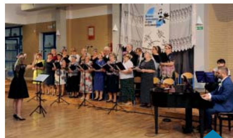
Zespół śpiewaczy obchodził swoje 40. Urodziny.

Bartłomiej Stefański