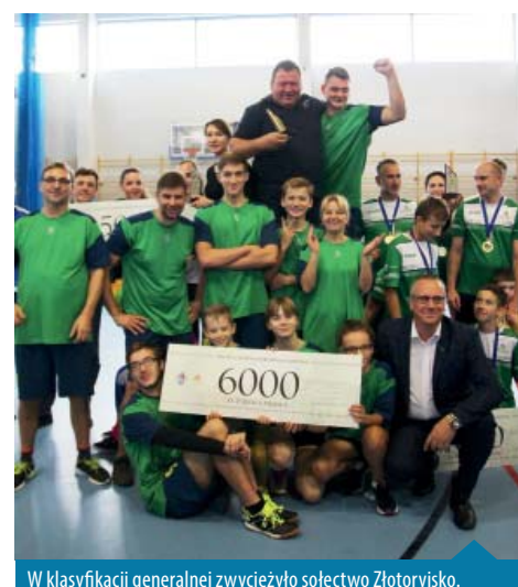
W klasyfikacji generalnej zwyciężyło sołectwo Złotoryjsko.