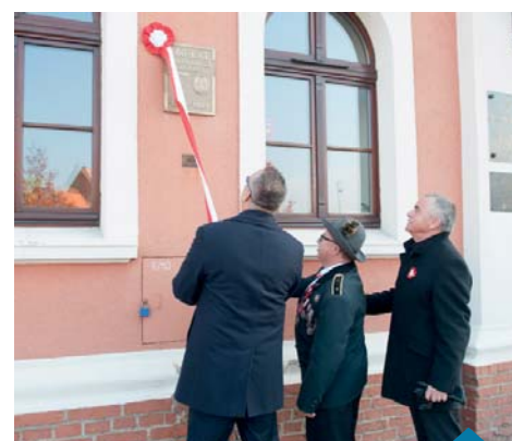
Odsłonięte zostały tablice upamiętniające: 600-lecie miasta z roku 1989 i 100-lecie niepodległości.