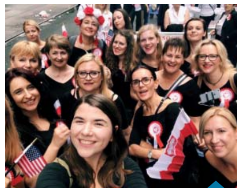
Chórzystki podczas Parady Pułaskiego.

W programie naszego pobytu w Nowym Jorku było również zwiedzanie. Tym razem nie starczyło czasu na muzea, ale byłyśmy na słynnym Times Square, Rockefeller Center, Lincoln Center, gdzie mieści się gmach Metropolitan Opera i Juliard Music School. Popłynęliśmy też promem na Staten Island oglądając Statuę Wolności i piękny widok na dolny Manhattan. Ogromne wrażenie zrobił na nas National 11 September Memorial. Pomnik składa się z dwóch głębokich basenów, umieszczonych dokładnie w miejscu, gdzie znajdowały się fundamenty zawałonych wież. W dół każdego z basenów, po ich ścianach, nieustannie spada woda. Na panelach okalających zbiorniki wygrawerowano nazwiska wszystkich ofiar zamachów z 1993 i 2001 r.