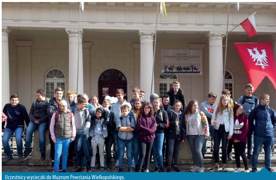
Uczestnicy wycieczki do Muzeum Powstania Wielkopolskiego.