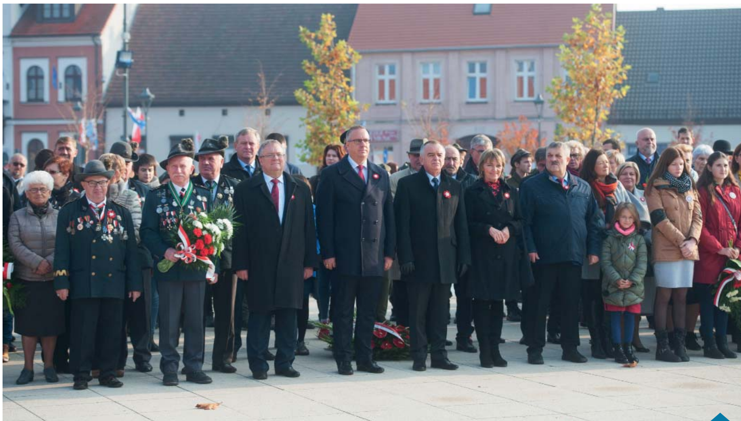
Uroczystości na placu Powstańców Wielkopolskich.