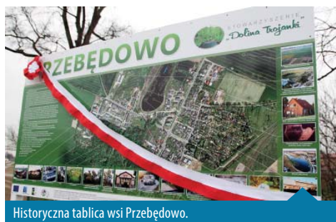
Historyczna tablica wsi Przebędowo.