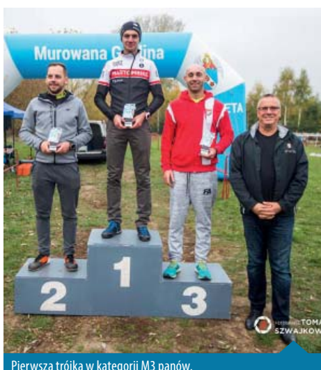
Pierwsza trójka w kategorii M3 panów.