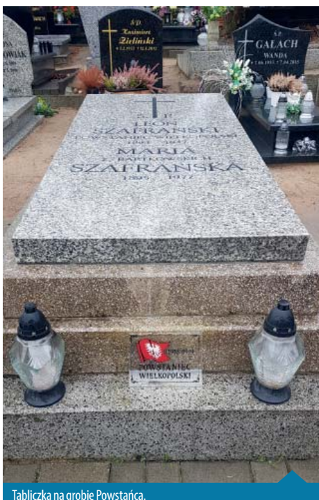
Tabliczka na grobie Powstańca.