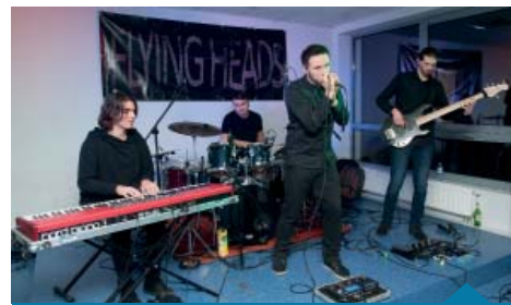
Paranoid Mind – bardzo ciekawy eksperyment muzyczny.

najpopularniejszych refrenów. Wreszcie na deser Paranoid Mind z Obornik, którego debiutancki album „Ascendence” ukazał się w czerwcu br. Muzyka, jaką tworzy zespół Paranoid Mind to połączenie ostrego, mocno rytmicznego grania z nietypowymi harmoniami i charyzmatycznym wokalem. Progresywny rock, ale klawiszowe