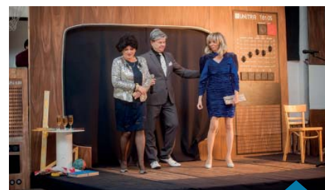
Nauczyciele wcielili się w role postaci znanych z lat 80-tych.