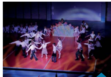
Spektakl w hali widowiskowo-sportowej w Murowanej Goślinie.

Wielkie wyrazy uznania i serdeczne podziękowania składamy wspólnie