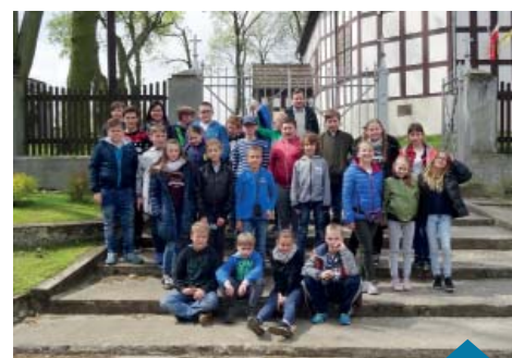
Pamiętkowe zdjęcia przy jednym z kościołów na szlaku.

W trakcie wycieczek uczniowie zbierali informacje i wykonywali zdjęcia, które następnie wykorzystali do tworzenia portfolio przedstawiającego poszczególne zabytki sakralne. Wykorzystano je również do stworzenia w grupach plansz