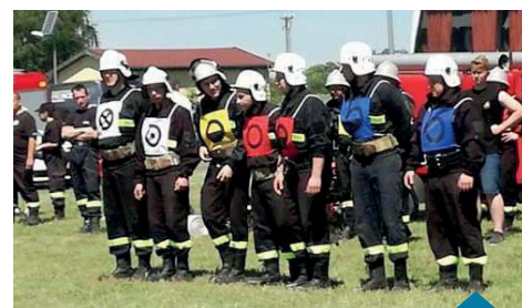
OSP Długa Goślina podczas zawodów.

zajęła OSP Zakrzewo, trzecie miejsce przypadło OSP Mrowino. Rywalizacja była bardzo wyrównana, o czym świadczy niewielka różnica punktowa w klasyfikacji końcowej. Druhowie z OSP Długa Goślina, dopingowani przez licznie zgromadzonych „swoich” kibiców, zaprezentowali się bardzo dobrze, godnie reprezentując naszą gminę. Podczas zawodów odbył się również pokaz strażacki (OSP Zakrzewo) według regulaminu tradycyjnych międzynarodowych zawodów pożarniczych, powszechnie w Polsce nazywany regulaminem CTIF.