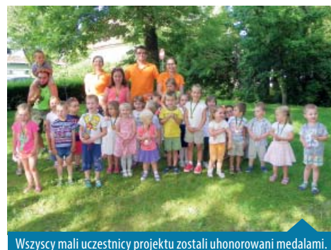
Wszyscy mali uczestnicy projektu zostali uhonorowani medalami.

Na zakończenie maluchy otrzymały „słodkie rogi obfitości” oraz balony, a całość zwieńczył „deszcz” kolorowego konfetti. Chcielibyśmy jeszcze raz podziękować wszystkim osobom zaangażowanym