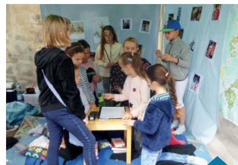
Młodsze dzieci chętnie brały udział w warsztatach plastycznych.

W każdym zakątku szkolnego boiska na dzieci i rodziców czekały liczne atrakcje: kiermasze książek, stoisko ze zdrową żywnością, popcorn, wata cukrowa, kiełbaski z grilla, kawiarenka z najpyszniejszymi, bo upieczonymi przez rodziców, ciastami. Odbywały się turnieje piłki nożnej i siatkowej, skoki w workach, slalom traktorkiem, twister, malowanie twarzy, malowanie palcami. Ogromnym zainteresowaniem cieszyła się nauka pisania japońskich znaków oraz budowanie domków dla owadów. Młodsze dzieci chętnie robiły gniotki, maski, brały udział w warsztatach plastycznych, wykonywały piniaty pod okiem starszych kolegów. Rodzice chętnie kupowali wykonane przez uczniów i nauczycieli przedmioty na stoisku makramy i decoupage, a kolejka do bramki-niespodzianki zawsze była bardzo długa. Dużo radości przyniosła też prezentacja szkoły tańca Espaniol, która przygotowuje naszych uczniów do