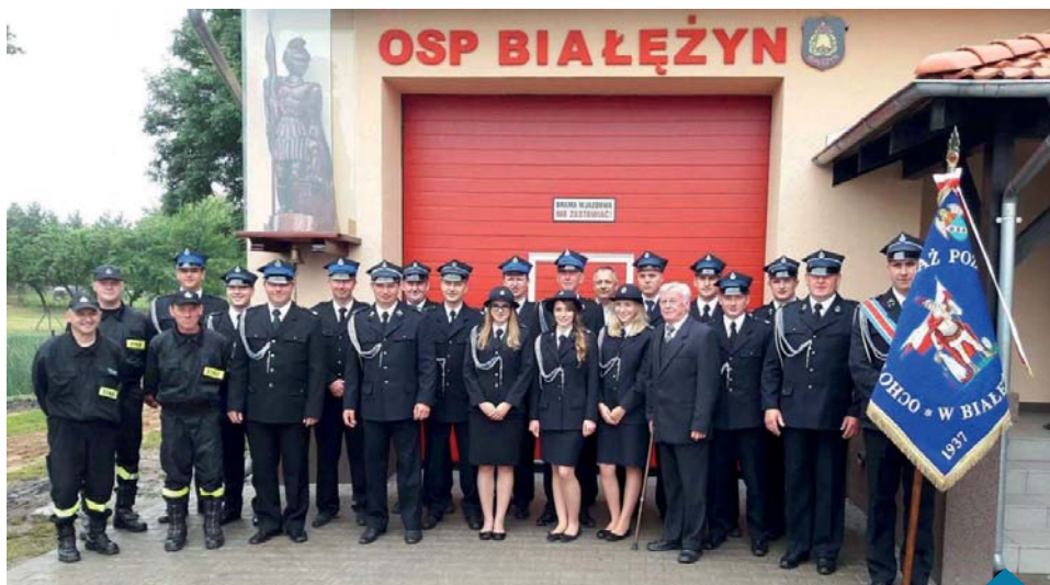
Jednostka OSP Białężyn wraz z nowym sztandarem.

Po przywitaniu odczytano historię jednostki OSP w Białężynie. Następnie