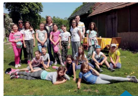
Kabaret na jednej nodze vel Horrorek wraz z opiekunami.