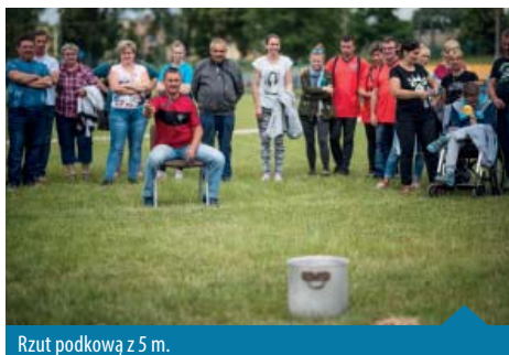
Rzut podkową z 5 m.

zostaną przeznaczone na zadania inwestycyjne w 2018 roku.