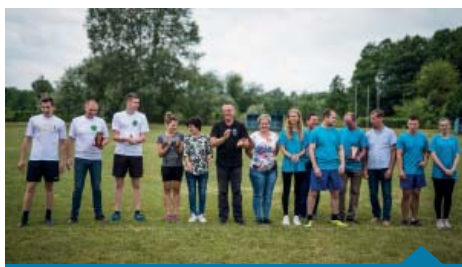
Zwycięskie zespoły z burmistrzem Urbańskim.