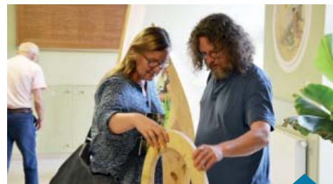
Publiczność przybyła na otwarcie wystawy miała okazję dotknąć tych sfer bezpośrednio w obecności autorki.