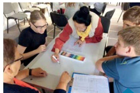
W trakcie junioralno-senioralnych warsztatów rozmawialiśmy, dyskutowaliśmy i poznawaliśmy się wzajemnie.

Projekt został realizowany dzięki pomocy Urzędu Miasta i Gminy Murowana Goślina,