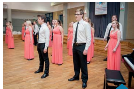
Chór Młodzieżowy „Defrost” z Hamar w Norwegii.

Arleta Włodarczak